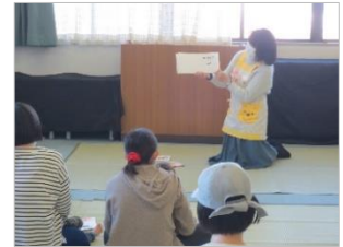
「あかちゃんと楽しむ絵本とわらべうた」の様子