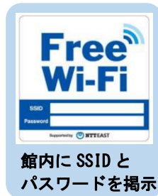
館内に SSID とパスワードを掲示

調べ物等のためのウェブサイトが閲覧できるインターネット端末を設置しています。1人1日1回30分までです。※ サイト指定あり