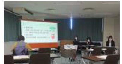
※今回の策定計画の『パブリックコメント説明会』の様子です。説明会にお越しいただきました皆様、ありがとうございました。