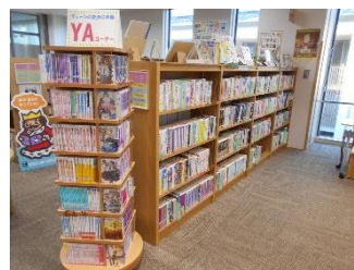
本館・分館の【YAコーナー】にはライトノベルを集めた棚もあります (写真は分館 YA コーナー)